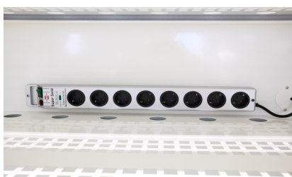
8-vägs grenuttag med överspänningskydd ovanför perforerad hylla.