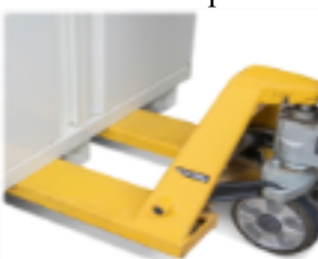
Lyfts lätt med pallyftare