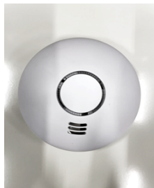
Invändigt & utvändigt larm