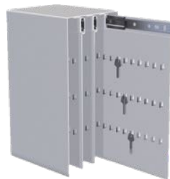
Nyckelkasett 168 krok