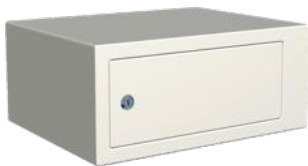
Låsbart fack, 150 mm. H190 x B440 x D310 mm