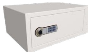
Låsbart fack med kodlås H190 x B440 x D310 mm