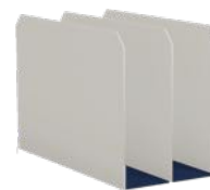
Laptofhållare, 2 fack H225 x B150 x D320 mm