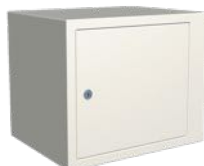
Låsbart fack, 340 mm. H380 x B445 x D340 mm