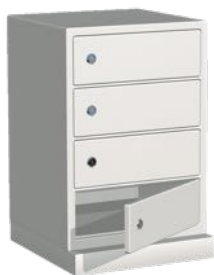
Fackmodul, 4 fack H583 x B450 x D390 mm