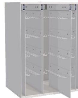
Nyckelkasett 192 krok Finns även med 504 krok