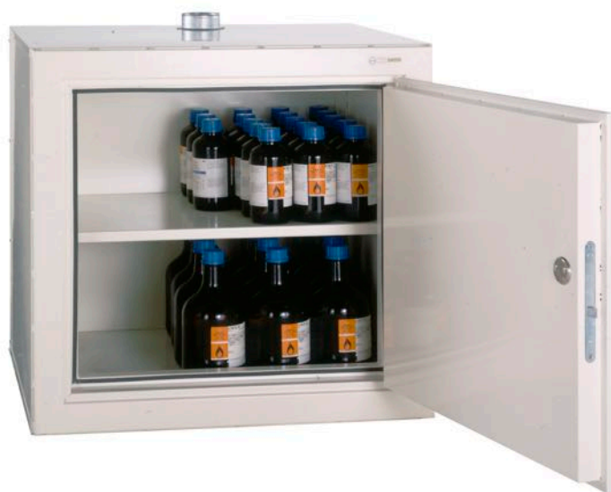
EI30-KEM1 med hylla

Se även våra kemikalieskåp enligt den Europeiska laboratoriestandarden 14470-1.