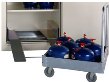
Vagn inkl. ramp