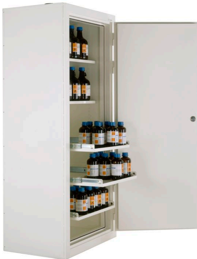
EI30-KEM3 med utdragbara hyllor och flyttbara hyllor